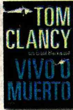
Vivo o muerto Tom Clancy Umbriel, 2011. $17.000

Tras investigar más de 5 años, en treinta países distintos, con más de mil 200 entrevistas, el sociólogo y periodista Frédéric Martel busca la respuesta a cómo se fabrica un best seller y llega a la conclusión de que hoy se da una guerra mundial por los contenidos. Él analiza la cultura mainstream, en la que participan gigantes del entretenimiento, que tienen redes de influencia y poder por todo el planeta.