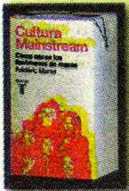
Cultura Mainstream Frédéric Martel Taurus, 2011. $19.160

Jack McEvoy está viviendo sus últimos días como reportero policial en Los Angeles Times. Él se sabe en la mira y va tras su último caso, que resulta ser el más increíble de su carrera. Un adolescente drogadicto es acusado del asesinato de una mujer. Pero McEvoy descubre que él no sería el culpable del crimen y siguiendo la pista, encuentra a un criminal que lleva años actuando sin ser descubierto. En el proceso lo ayuda una amiga del FBI.